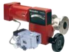
Seria 35002 Camflex II Eccentric plug (obturator eccentric)