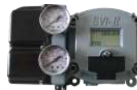
SVI II AP Pozționer diagnoză avansată