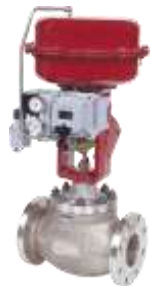
Seria 21000 Corp drept/în unghi

Câteva dintre cele mai de succes echipamente vândute în România sunt prezentate în acest slide.