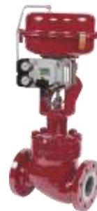
Seria 41005 Corp drept /în unghi