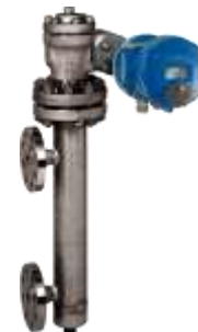
Seria 12400 Traductor de nivel Digital